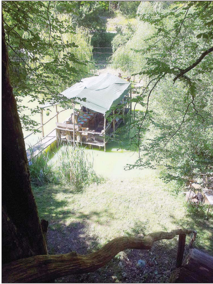
La cabane a été installée au milieu d'un étang. Un rêve, tout comme pour celle installée dans un chêne.