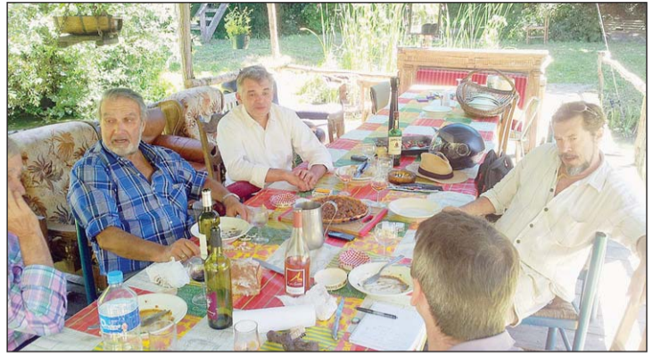
Des bandes de copains, des inconnus d'un jour... les repas chez Michel sont toujours inoubliables.